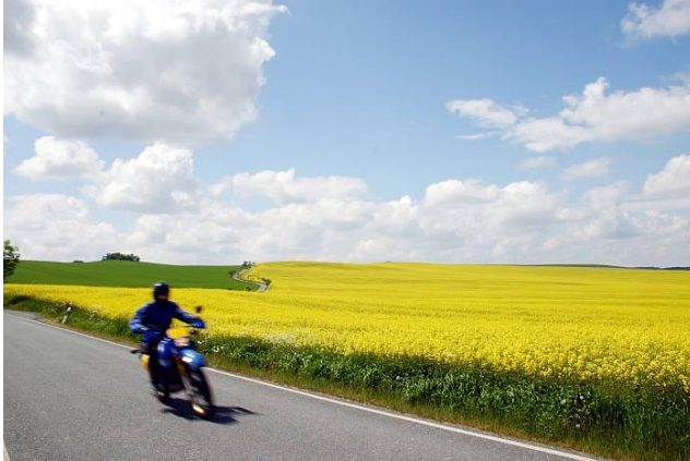
Schwarzenburg, Im April 2012